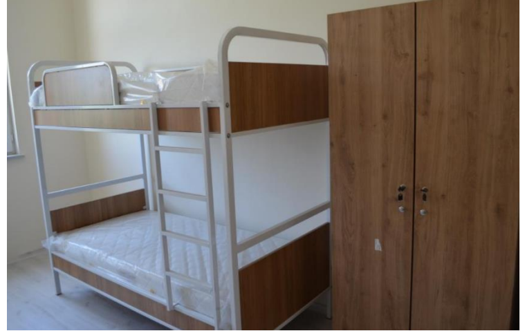
BİR PANSİYON ODASI